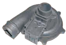
无支撑 蜗壳 AlSi10Mg 277mm*250mm*122mm