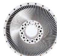
叶轮 IN718 高温合金 Φ380mm*156mm