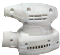
电动工具外壳 尼龙 135mm*40mm*100mm