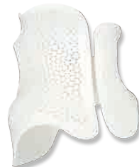
脊柱矫形器 尼龙 320mm*280mm*350mm