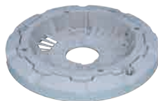
电机底座壳体 尼龙 340mm*340mm*50mm