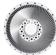
叶轮 IN718 高温合金 Φ380mm*156mm