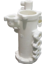
壳体 PSB 粉末 160mm*200mm*300mm