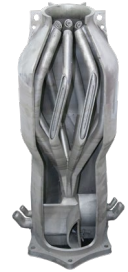
尾喷 IN718 高温镍基合金 Φ370mm*870mm