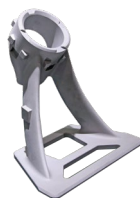
卫星支架 铝合金 220mm*180mm*230mm