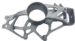
转向立柱 铝合金 265mm*160mm*60mm