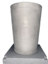
导弹筒分段 钛合金 Φ220mm*310mm