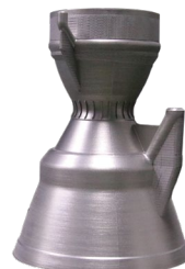
全尺寸喷嘴 IN718 高温镍基合金 230mm*401mm*554mm