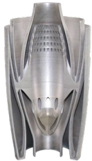
燃烧室 GH4169 φ308mmx603mm