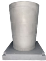
导弹筒分段 钛合金 Φ220mm*310mm