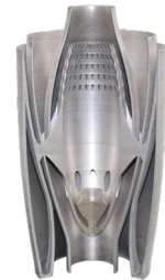
燃烧室 GH4169 Φ308mm*603mm