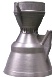
全尺寸喷嘴 IN718 高温镍基合金 230mm*401mm*554mm