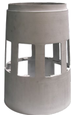
舱段 铝合金 Φ340mm*470mm