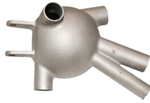
直升机多维度接头 30crmosi 105mm*90mm*200mm