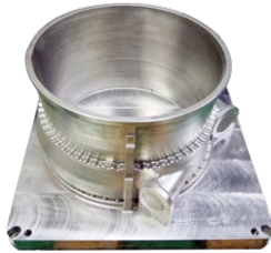
机匣 IN718 高温镍基合金 Φ500mm*300mm