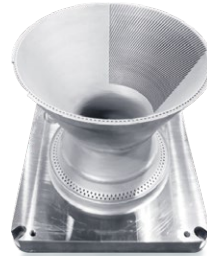
尾喷 钛合金 (TC4) Φ394mm*341mm