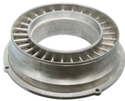
涡轮 IN718 高温镍基合金 Φ620mm*150mm