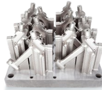
飞机燃油喷嘴 IN718 高温镍基合金 125mm*45mm*65mm( 单个)