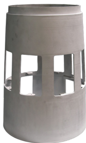
舱段 铝合金 Φ340mm x470mm