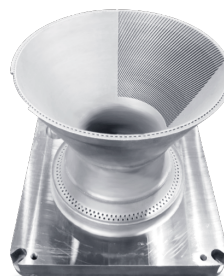
尾喷罩 TC4钛合金 Φ393mm*340mm